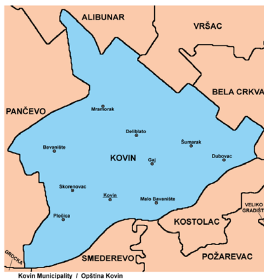
Слика 1.1. Општина Ковин

У непосредној близини Ковина налазе се развијени привредни центри и центри друштвеног живота: Београд на 50 км, Панчево на 34 км, Смедерево на 13 км. Саобраћајна повезаност са центрима је добра - друмски саобраћај. Изградњом моста на Дунаву, 1976. године, оживео је друмски саобраћај, с обзиром на знатно скраћење друмске везе са деловима средње и јужне Србије. У непосредној близини Ковина, на путу ка Београду изграђена је аеродромска писта за потребе војске, која представља значајан инфраструктурни објекат. "Дунавац", рукавац Дунава дуг око 1,8 км. који пролази непосредно уз радну зону Ковина, користи се као лука и зимовник који је делимично уређен за ове привредне потребе.