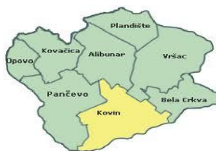
Положај општине Ковин у Јужнобанатском округу

Општина Ковин има облик неправилне пирамиде. У геоморфолошком погледу простире се највећим делом на лесној тераси и алувијалној равни Дунава. Јужну границу Општине чини река Дунав у дужини од 46 км, док на северу захвата Делиблатску пешчару, која од укупне површине од 29.620 ха, 63% припада подручју општине Ковин. Пешчара и Подунавље су две зоне које се преклапају у општини Ковин. Општина Ковин лежи на 20°05' - 20°23' источне географске дужине и 44°52' - 45°05' северне географске ширине. Општина лежи на надморској висини од 72 - 120 метара.