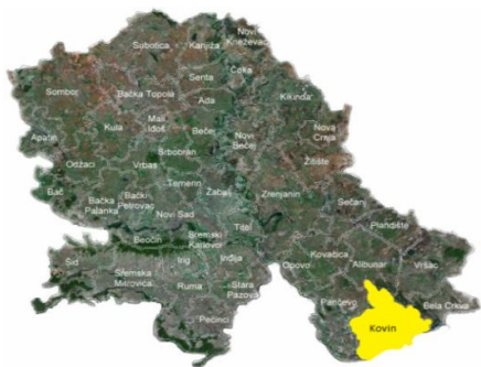
Положај општине Ковин у АП Војводини

Општина Ковин се налази у Јужнобанатском округу, у саставу АП Војводине. Подручје Општине простире се на 730 км, што представља 3,37% површине статистичког региона Војводине. Општина Ковин по пространству заузима осмо место у Војводини.