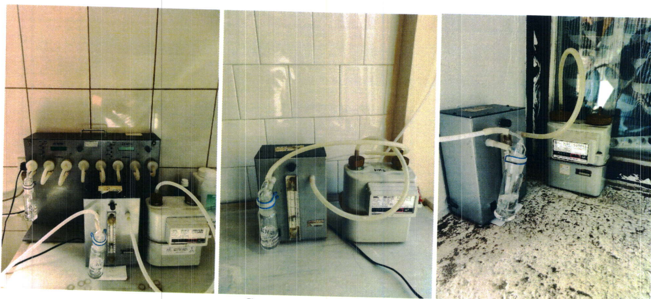
Слика 3. Опрема

Опрема коришћена за узорковање и одређивање концентрација сумпордиоксида, азотдиоксида, амонијака, чађи и суспендованих честица фракције PM_{10} из ваздуха приказана је на слици 3 .