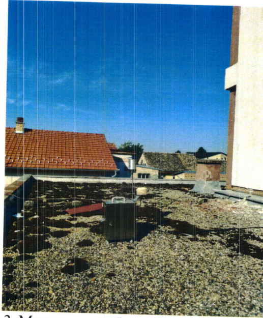
Слика 2. Мерно место бр.1. Ковин – Дом здравља