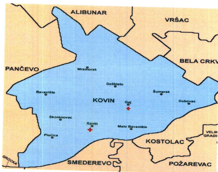
Слика 1. Положај општине Ковин

Општина Ковин једна је од осам општина јужнобанатског округа. Заузима површину од 730km 2 (од чега на пољопривредну површину отпада 47.753ha, а на шумску 10.266ha). Седиште општине је град Ковин са изузетно повољним положајем јер је раскрсница значајних путева који га повезују са Белом Црквом, Панчевом, Вршцем и Смедеревом. Општину Ковин чини 10 насеља: Ковин, Делиблато, Мраморак, Баваниште, Мало Баваниште, Гај, Шумарак, Дубовац, Плочица, Скореновац. Ковинска општина има облик неправилне пирамиде. Простире се највећим делом на лесној тераси и алувијалној равни Дунава. Јужним делом општине протиче река Дунав која представља значајан пловни пут за транспорт роба и путника.