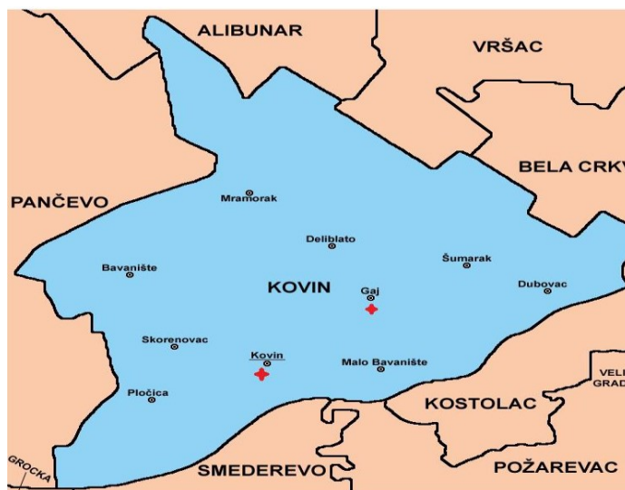
Слика 1. Положај општине Ковин

Општина Ковин једна је од осам општина јужнобанатског округа. Налази се на надморској висини од 79m и заузима површину од 730km 2 (од чега на пољопривредну површину отпада 47.753ha, а на шумску 10.266ha). Седиште општине је град Ковин са изузетно повољним положајем јер је раскрсница значајних путева који га повезују са Белом Црквом, Панчевом, Вршцем и Смедеревом. Општину Ковин чини 10 насеља: Ковин, Делиблато, Мраморак, Баваниште, Мало Баваниште, Гај, Шумарак, Дубовац, Плочица, Скореновац. Ковинска општина има облик неправилне пирамиде. Простире се највећим делом на лесној тераси и алувијалној равни Дунава. Јужним делом општине протиче река Дунав која представља значајан пловни пут за транспорт роба и путника.