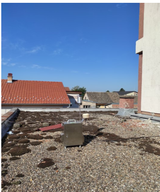
Слика 2. Мерно место бр.1. Ковин – Дом здравља