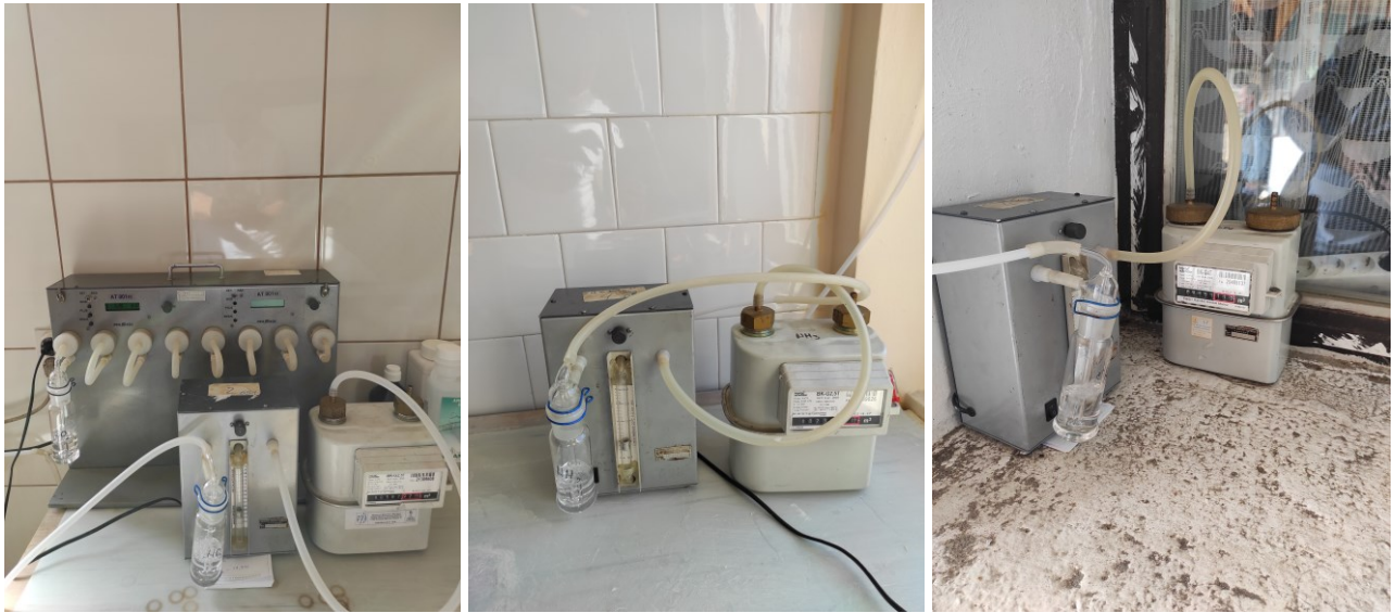
Слика 3. Опрема