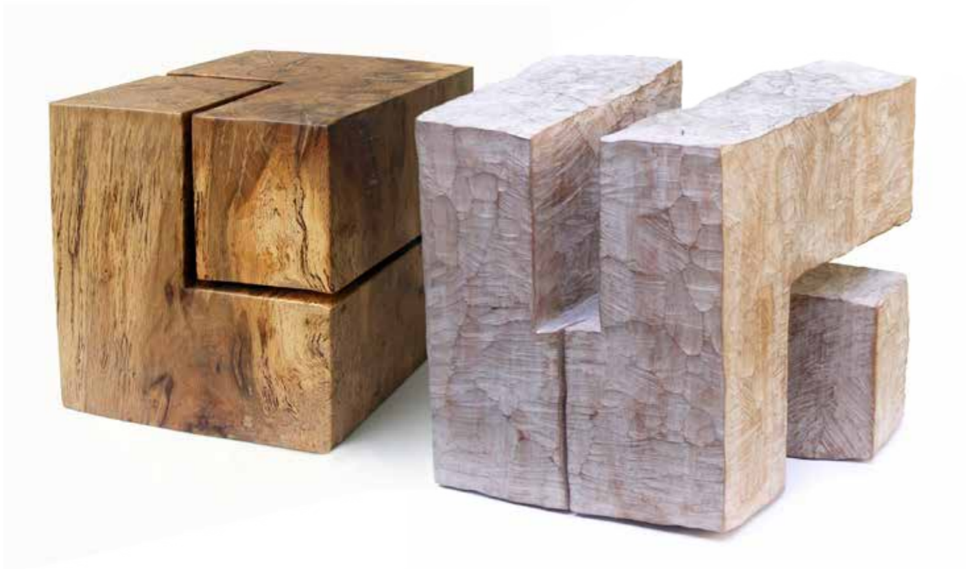
Скулптуре, 2011/2012, дрво, 24x25x28 и 37x32x29 цм

елемента различитих димензија који су природно разнобојни у једну скулпторску целину. Уклапање појединачних сегмената она постиже преклапањем и усецањем у форму или утапањем са циљем да сегменти остану чврсти и непомерљиви у односу на остале, као повољност за самоодрживост склопа. Појединачне форме, њихова обојеност и структурираност у целинама скулпторских облика доприносе и динамичности и потпуној оживљености, рекло би се раздраганости, камене материје.