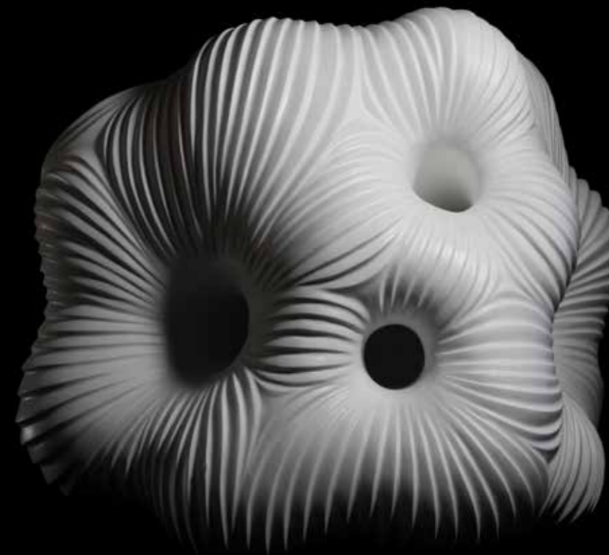
Бело као снег, 2018/2019.