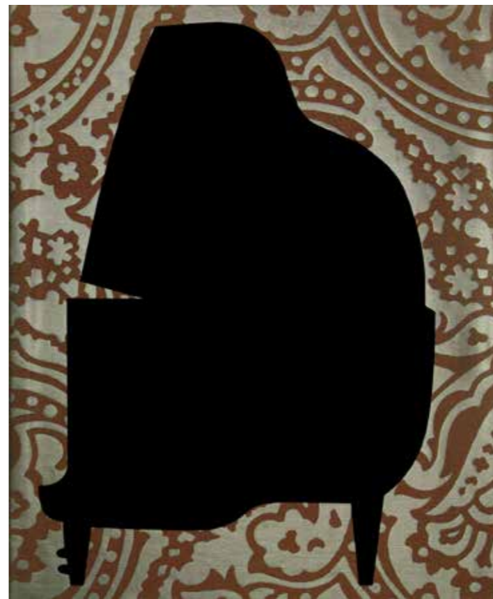
Неограничено, инкжет принт на платну 20x24 цм, полиптих од 25 комада, димензије променљиве, 2020.

Свака скулптура је масивна и монументална у изразу целина, настала репетицијом/спајањем неколико истоветних или сличних делова, са средишњим перфорираним местом, па се јавља дилема да ли је облик тек у настајању или је у разградњи. Супротстављеност спољашње геометризоване редукване