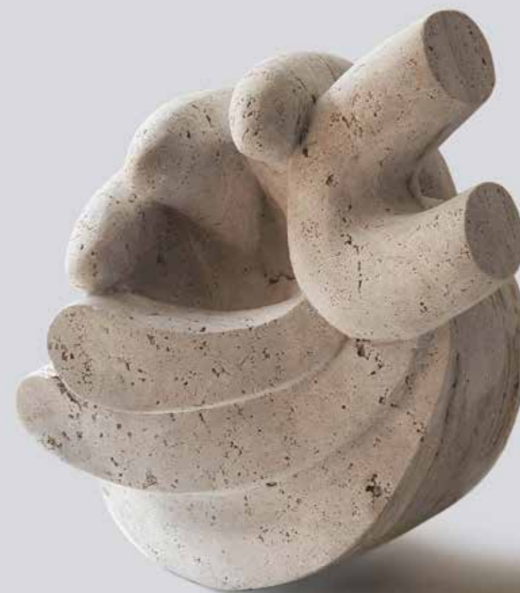
Марко Вучковић, Победа, мермер, 40x40x43 цм, 2023.

и паузе између њих – променљиви и увек нови просторни интервали“.