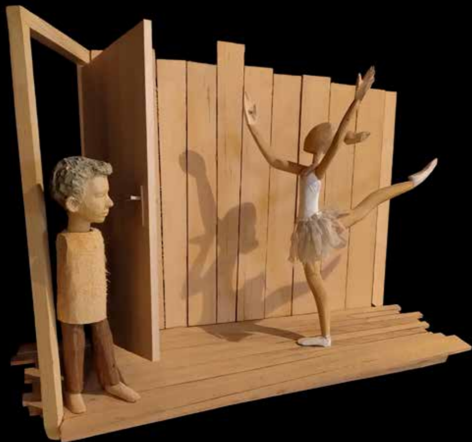
С намером дођох у велики град, 2018. дрво, текстил, 60x50x20 цм

међуодноса маса као ритамско секвенционирање. У том континууму, покушава да укаже на простор до оне „тачке“ да он може бити трансформисан у енергетско поље, не само физички реалан ентитет, у исконски простор ослобођен димензија које коегзистирају.