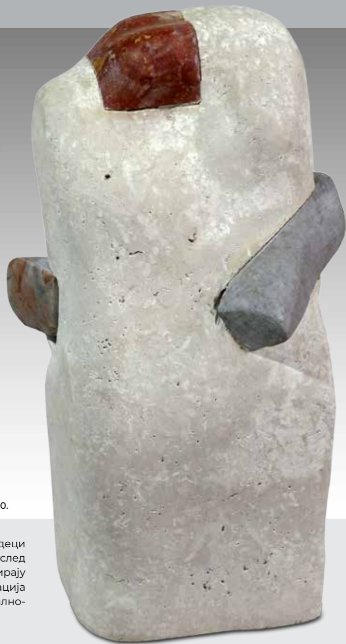
Асоцијација II , 40 x 22 x 19 cm, мермер / кречњак, 2020.

који могу бити заводљиви и манипулативни; деци прети, и буквално речено и метафорички, услед разноврсних штетних утицаја који се инвестирају у савремено детињство, инструментализација одрастања у сврху конзумеризма и социјално-медијске интеграције.