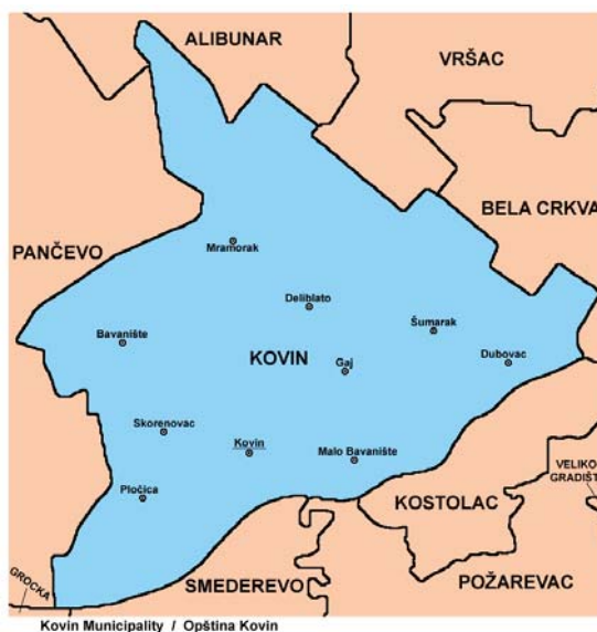
Слика 1.1. Општина Ковин