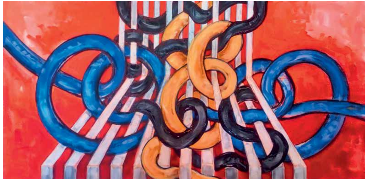
“Гордијев чвор”, 80x50 цм