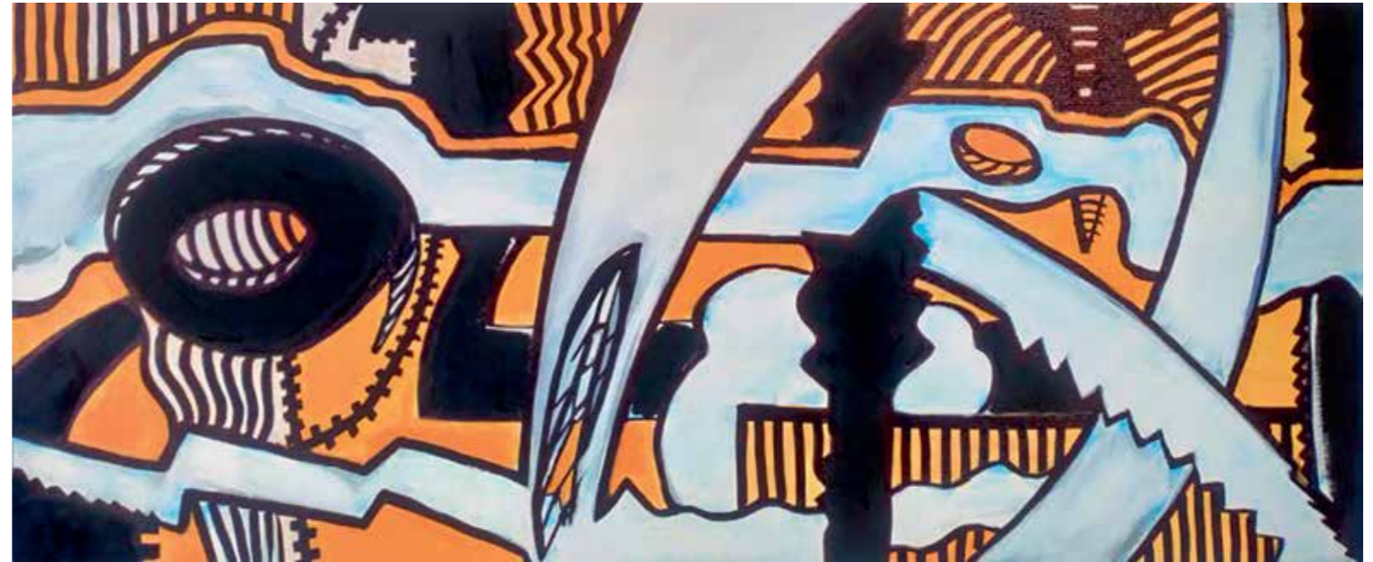
“Калауз”, 70x30 цм

Имала 20 самосталних и велики број групних изложби.