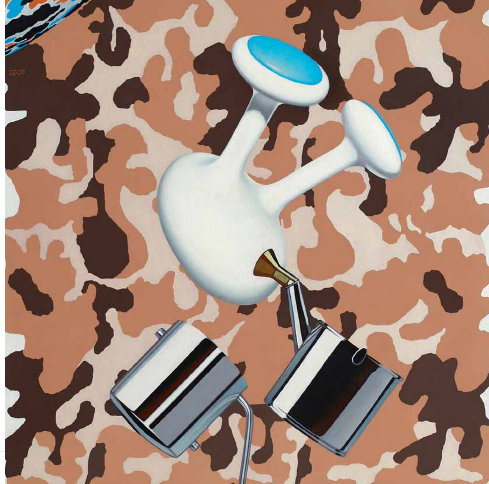
Мали принц (деталј), уље на платну, 90x140, 2006.

Део његових радова налази се у појединим музејским и галеријским збиркама, као и приватним колекцијама: Музеј савремене уметности Београд, Christen Sveaas Art Foundation (Oslo), Музеј «Museu do Douro» (Португалија), Уметничка збирка Мадлене Цептер, Колекција Фондације Саша Марчета, Београд, Народни музеј Врање, Музеј Младеновца, Град Београд (отк.), Опера и Позориште Мадленијанум, LIA - Leipzig International Art-Program, радови у приватним збиркама у Берлину (A.Schlag), Лајпцигу (Lenzer), Цириху (SCHLATTER), Бечу (Zepter i Graf...), активно излаже на бројним групним (70) и самосталним (24) изложбама у земљи и иностранству од 1993 године.