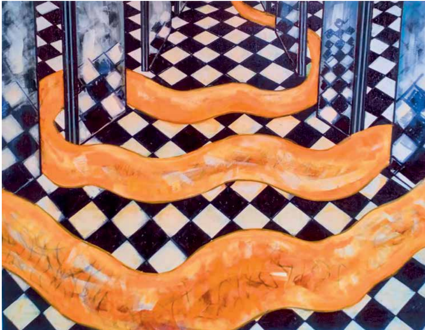
“Боа и дворана огледала”, 70x55 цм

Радови су из циклуса Мимезис (од грчког mīmēsis ). Појам Мимезис представља имитирање стварности. По Платону Мимезис не имитира природу већ је то моменат у коме се испуњава стварност.